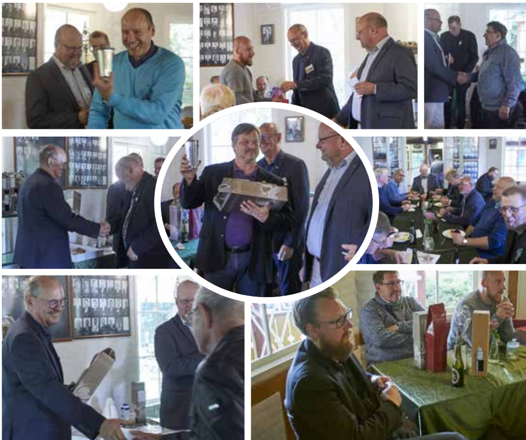
Fortsætter på side 10